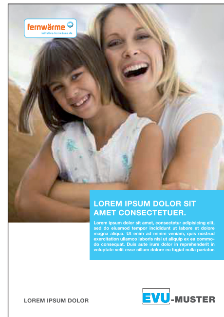
B: MARKE ORANGE | BLAU IM BILD