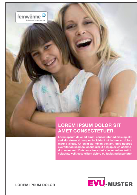
C: MARKE GRAU | BLAU IM BILD