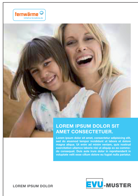
A: MARKE ORANGE | BLAU AUF WEISS